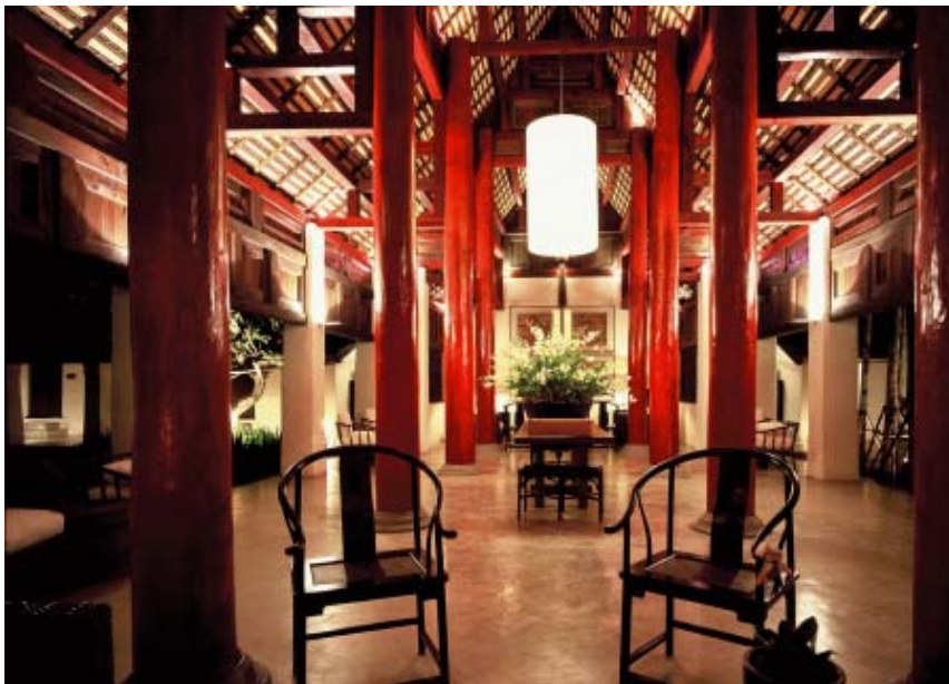
L'entrée du Rachamankha

Rachamankha en chambre Superior ( hôtel de charme : le premier « Relais et Châteaux » de Thaïlande) voir http://www.rachamankha.com