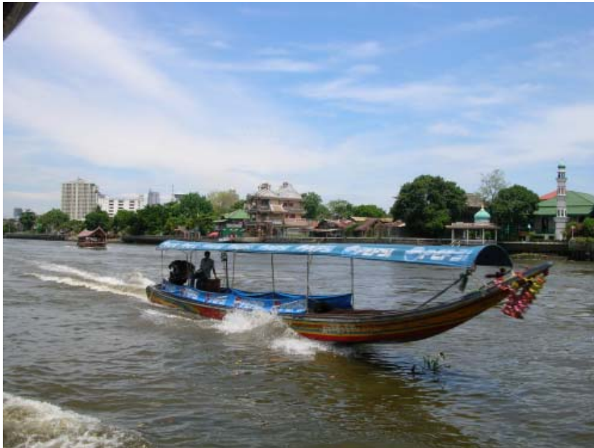
Vue du fleuve a Bangkok en centre ville