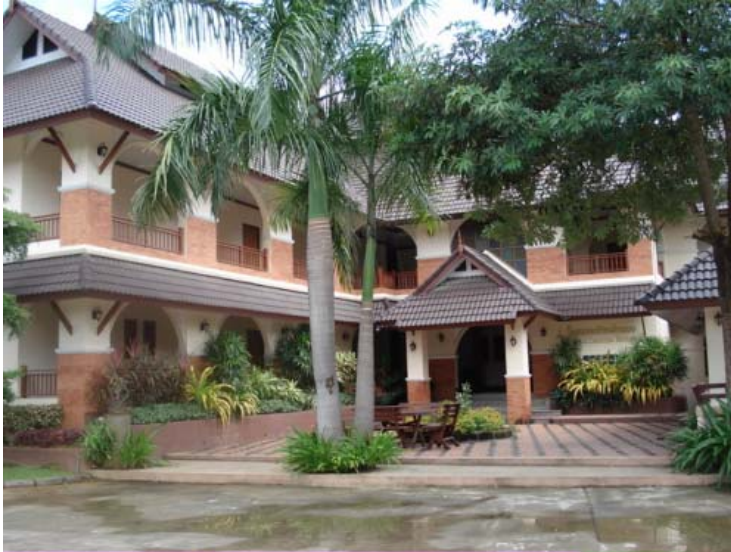
Vue de l'entrée du Baan Lanna