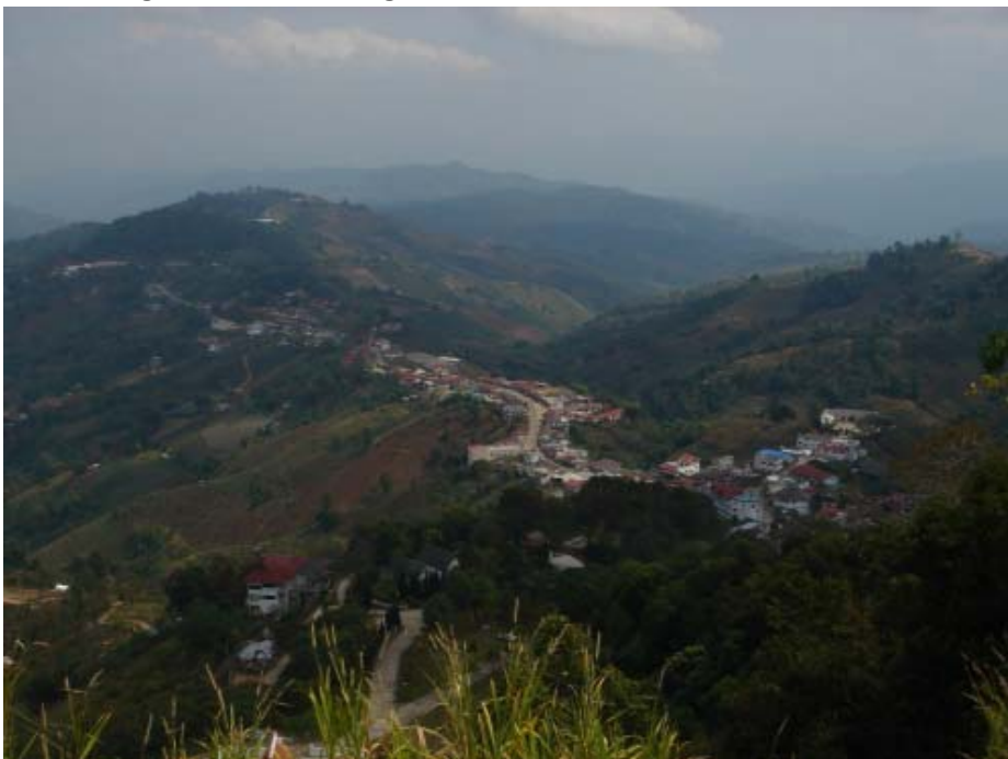
Les montagnes de MaeSalong