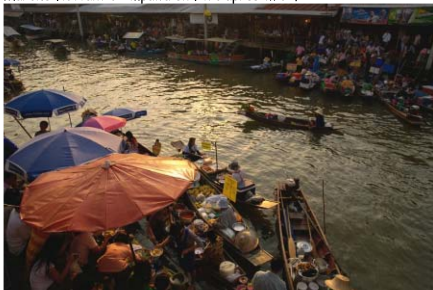
Marché flottant d'Ampawa en fin d'après-midi :