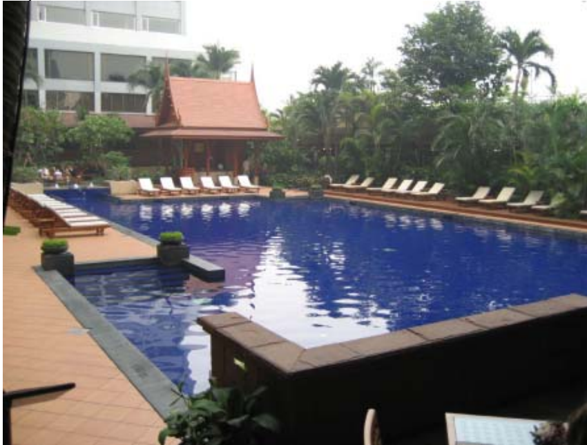
La piscine du Menam Riverside