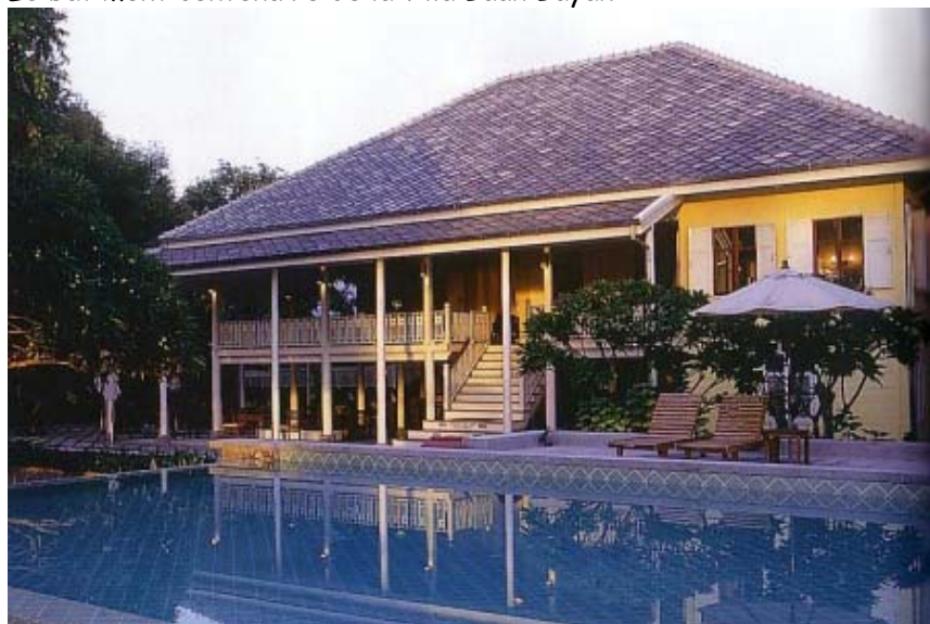
Le bâtiment centenaire de la villa Baan Bayan